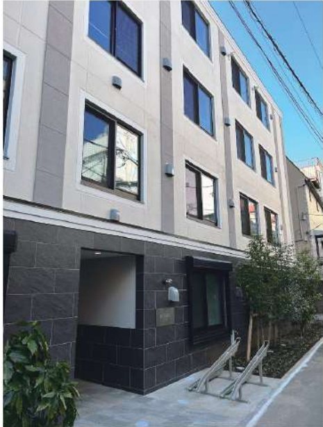
B type 20.82㎡