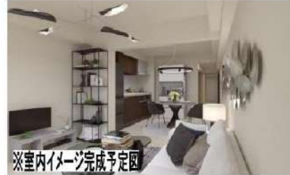
※室内イメージ完成予定図