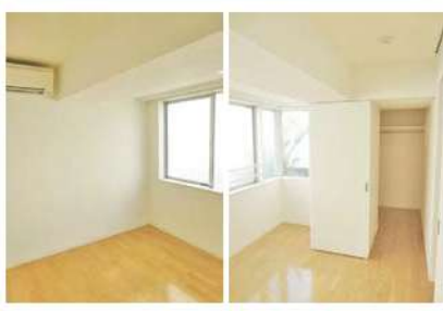
★洋室ウォークイン収納★