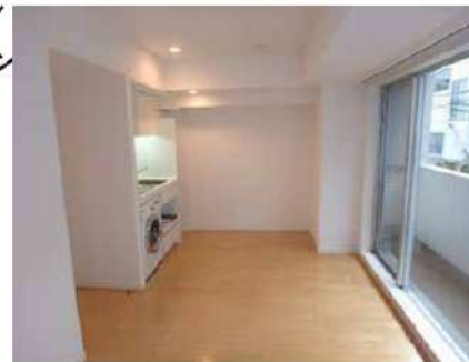
★ウォークイン収納のあるお部屋★