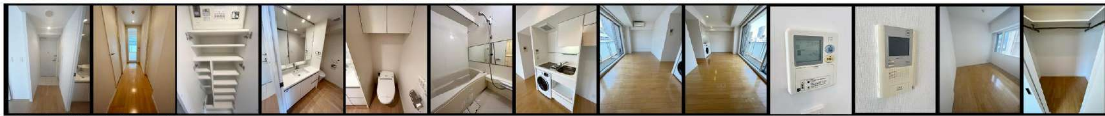
* 部屋の写真は別階同タイプの部屋のものを使用しています。