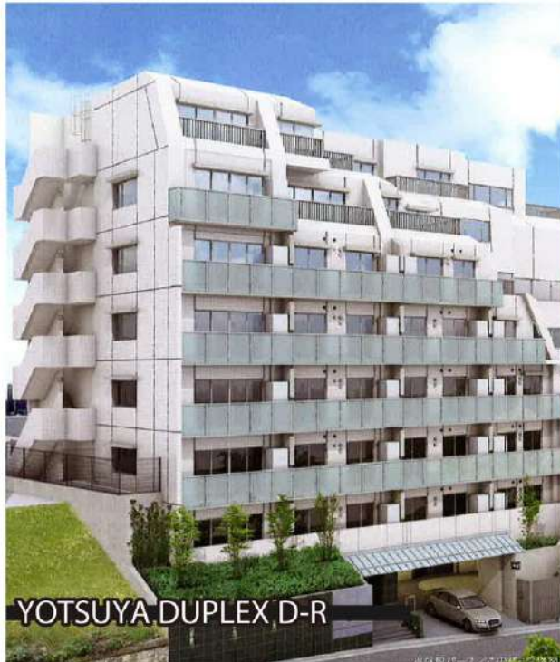
YOTSUYA DUPLEX D-R