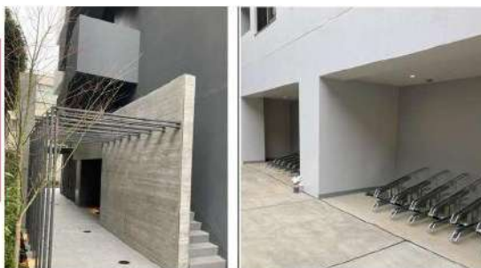
都営大江戸線「飯田橋」駅徒歩10分 都営三田線・大江戸線「春日」駅徒歩9分 東京メトロ丸の内線・南北線「後楽園」駅徒歩9分