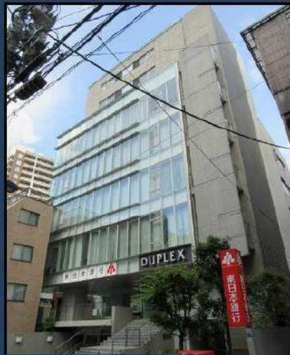
Outline-物件概要・賃貸条件-