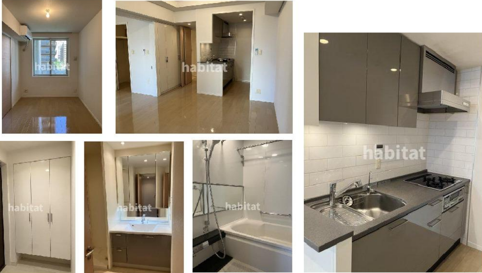
※同物件別部屋の参考写真となります