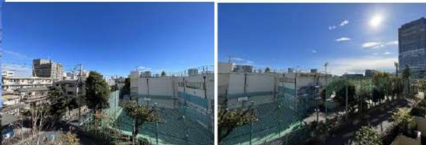
バルコニーからの眺望(南東側)