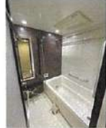
※カーテン類は賃貸に含まれません