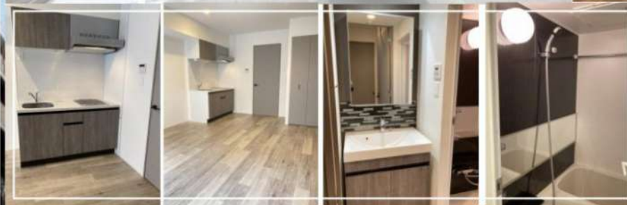
※写真は別区画のものです。