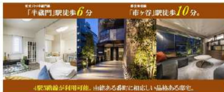
4駅5路線が利用可能。由緒ある番町に相応しい品格ある邸宅。