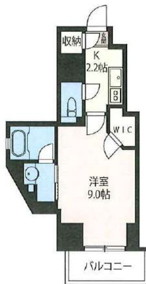
110号室 1K 29.81㎡