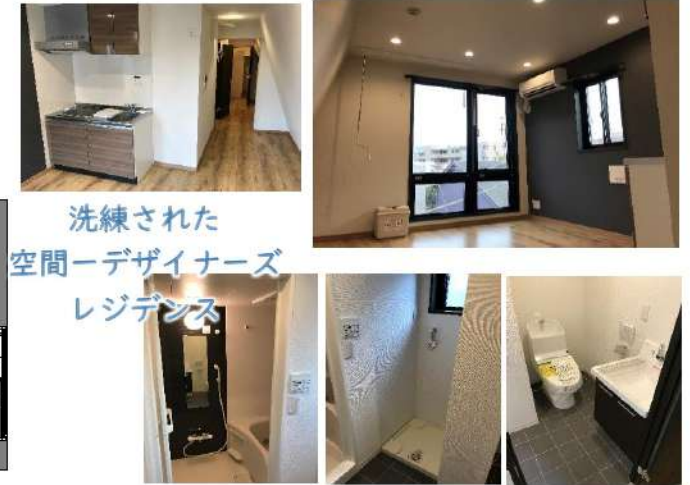
洗練された 空間デザイナーズ レジデンス