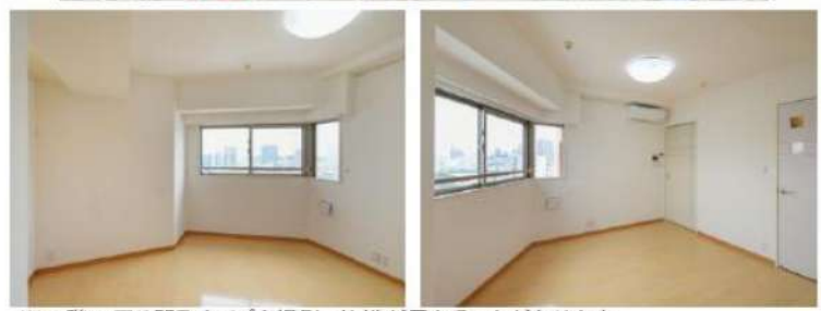
※11階の同じ間取タイプを撮影。仕様が異なることがあります。