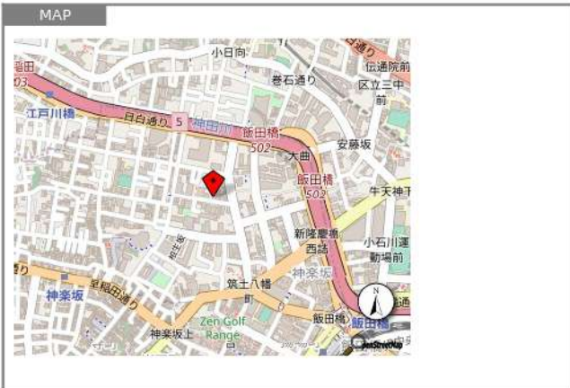
図面と現況が異なる場合は、現況優先といたします。

設備 地上波、ネット無料、BS、CS、光ファイバー、オートロック、集合郵便受け、宅配用ボックス、エレベーター、自転車駐輪可、有料バイク置場(大型)、エレベーター1基、外壁タイル張り、専用ゴミ置き場、モニター付インターホン、火災報知器、ダブルロック、ペット(犬猫可)、ルームシェア不可、給湯(ガス)、洗濯機、ガスコンロ設置済、コンロ口数2、コンロ種類 都市ガス、バス・トイレ別、シャワー、洗面所独立、温水洗浄暖房便座、室内洗濯機置場、シャンプードレッサー、浴室乾燥機、エアコン、下駄箱、収納スペース、クローゼット1ヶ所、電気30A、フローリング、照明器具、バルコニー、人感センサーライト、24H換気システム、都市ガス