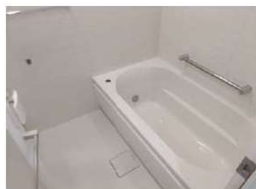
図面と相違する場合は現況を優先します