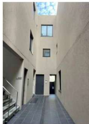
図面と相違する場合は現況を優先します