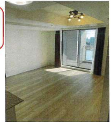
【リビングダイニング】